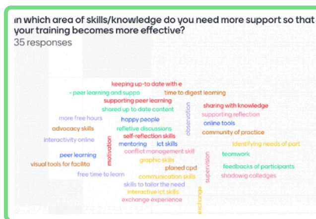
Online anketiranje sudionika na konferenciji ISSA Connects for Learning event (27. 10. 2023.)

Konačno, 2023. na konferenciji ISSA Connects for Learning predstavljeni su po prvi puta PIQET principi. Jedan je od zadataka PIQET predstavljanja bio mapirati područja za unaprjeđenje principa njihovim testiranjem sa sudionicima. Sudionike smo pitali opet u kojim područjima trebaju podršku kao KPR edukatori, a njihovi odgovori prikazani su desno.